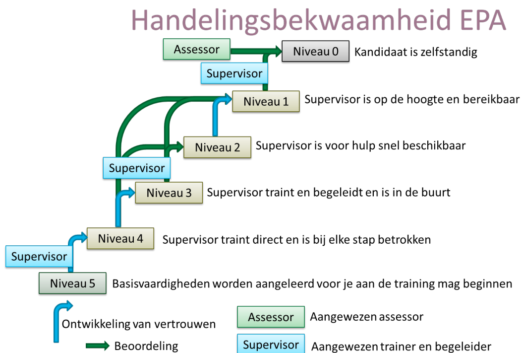
Figuur 1: Verloop van bekwaamheidsontwikkeling bij reguliere werknemers en stagiairs als trainee. Afhankelijk van het niveau ontvang de trainee begeleiding of toezicht. Bevordering naar een volgend niveau vindt plaats op basis van informele interne beoordelingen door de supervisor en formele beoordelingen door een assessor. Binnen de niveaus 4 tot 1 kunnen niveaus worden overgeslagen bij eenvoudige technieken. Een supervisor of assessor moeten worden aangewezen door de functionaris competenties. Het kan zijn dat de supervisor of de IvD vereist dat de trainee basisbekwaamheden aantoont voor deze aan een EPA training mag beginnen. In dat geval is de trainee nog niveau 5.

Handelingsbekwaam in de praktische uitvoering van dierproeven kan een medewerker op meerdere niveaus zijn. In dit beleid hanteren wij 6 niveaus die worden beschreven in figuur 2.